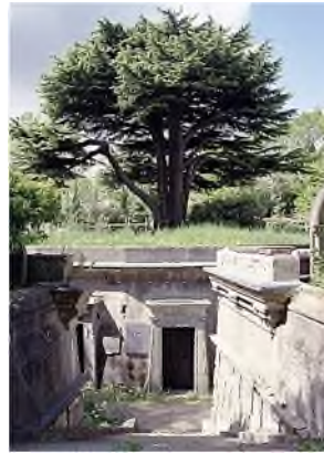
Circle of Libanon