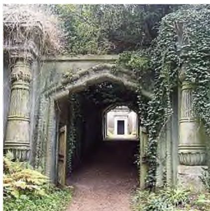
Londen-Highgate: Egyptian Avenue

De term 'catacombe' is in Rome 'uitgevonden' en werd gebruikt om de ondergrondse begraafplaatsen in het begin van de christelijke jaartelling aan te duiden. Later werd de term ook gebruikt voor andere ondergrondse begraafplaatsen. Ook werd de naam gegeven aan ondergrondse locaties zonder grafplaatsen en in de sportwereld wordt de term catacomben gebruikt voor de ruimte onder tribunes van voetbal- en ijsstadions.