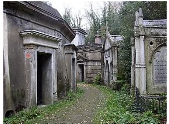
catacomben Egyptian Avenue