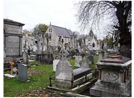
St. Mary's met kapel