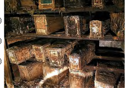
Catacombs under Episcopal Chapel