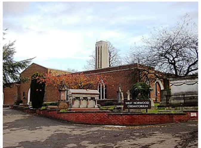
crematorium (oorspronkelijk Dissenters Chapel)