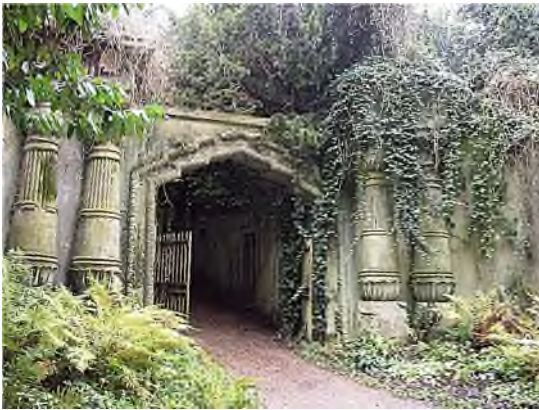
ingang Egyptian Avenue

Het meest chique destijds was je te laten begraven in een van de grafkamers van de Circle of Libanon , want de kosten daarvan waren alleen betaalbaar voor een exclusieve groep.