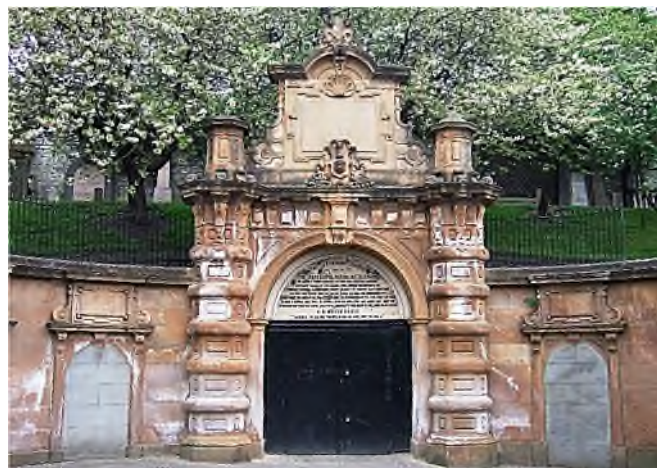
Glasgow-Necropolis: Entree Façade

In Londen werden op de commerciële Magnificent Seven verschillende catacomben gebouwd.