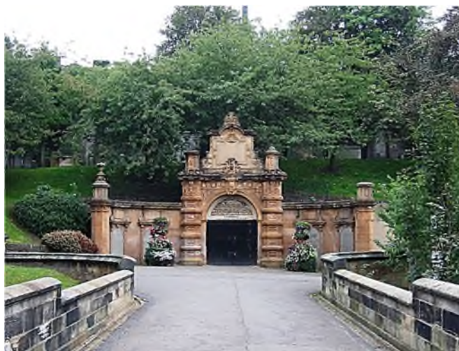
Glasgow-Necropolis: 'Brug der Zuchten'

In Groot-Brittannië waren in de 18e eeuw de churchyards overbevolkt. Er ontstonden allerlei wantoestanden. Op een halve ha werden in minder dan 20 jaar tijd 14.000 doden begraven. Het stonk er zo hard dat de doodgraver dronken moest zijn om zijn werk te kunnen volhouden. Voor een snellere 'doorstroming' werden lijken in stukken gehakt en verbrand, botten werden vermalen en verkocht als mest, lichamen werden gestolen en verkocht voor wetenschappelijke doeleinden; loden kisten werden verkocht voor de metaalprijs en houten kisten voor het brandhout. In die tijd werden veel lijken gevraagd voor sectie in de anatomische lessen op de universiteiten; een beetje mooi lijk bracht al gauw £ 20 op, hetgeen leidde tot diefstal en dus grafschennis. Deze mistoestanden leidden tot het verbod nog verder in steden te begraven en tot het ontstaan van private cemeteries , gesticht door commerciële ondernemingen, die zich vooral richtten op de rijken en met grootse bouwwerken, zoals catacomben, 'klanten' probeerden te trekken. De Rusholme Road Cemetery (1820) in Manchester was de eerste. Nu is het een park evenals de Liverpool Necropolis (1825). Ze werden