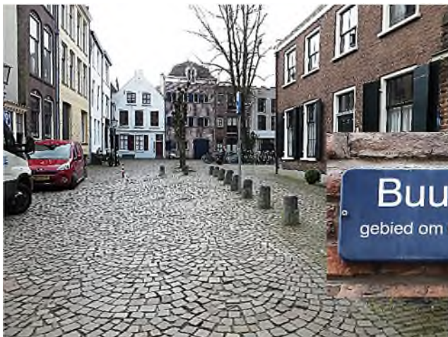
Buurkerkhof gebied om de Buurkerk 11e eeuw Museumkwartier