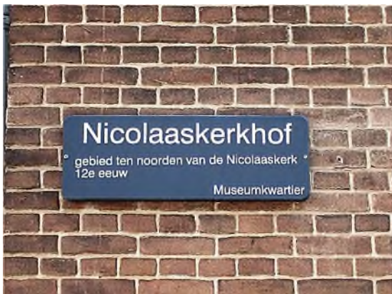
Nicolaaskerkhof en Nicolaïkerk: