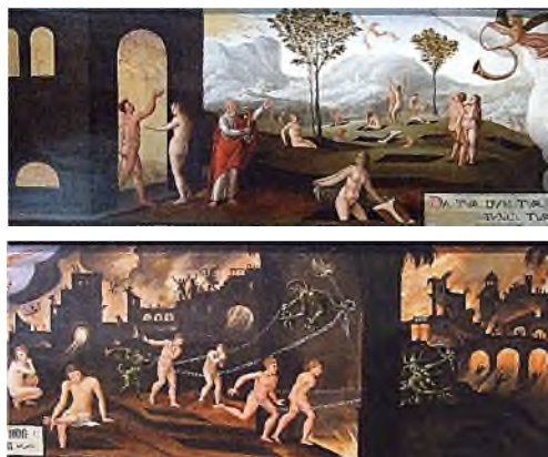
Laatste Oordeel: hemel en hel