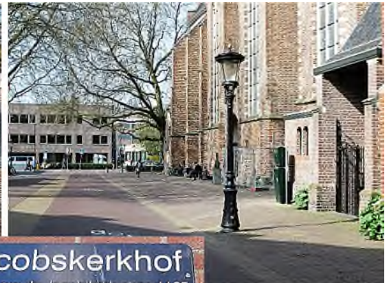
Jacobskerkhof gebied om de Jacobikerk circa 1125 Wijk C