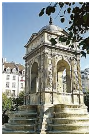
Fontaine des Innocents

In Parijs , dat voor de funeraire revolutie beschikte over zo'n 200 begraafplaatsen in de stad, meestal kerkhoven, werden na de gedwongen sluiting van die begraafplaatsen de graven geruimd en de stoffelijke resten overgebracht naar de Catacomben. Het was een jarenlange operatie, waarbij vooral 's nachts een onophoudelijke lijkstoet door de straten van Parijs trok met karren vol gebeente, begeleid door priesters, lijkbidder en 80 ingehuurde beroepshuilers ( pleurants ). Alleen al voor het Cimetière des Innocents wa-