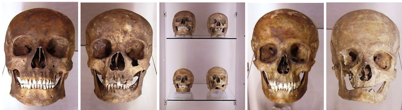
man ca. 47 jaar vrouw ca. 42 jaar - Eindhoven - vrouw ca. 33 jaar man ca. 55 jaar

In Eindhoven werd op het plein van de Catharinakerk in het centrum van de stad in 2002 bij een kleinschalige opgraving gekeken of er overblijfselen van de middeleeuwse kerk bewaard waren gebleven. Tot ieders verrassing bleek er ook goed geconserveerd skeletmateriaal aanwezig op het voormalige Sint-Catharina-kerkhof met als bijzondere vondst het skelet van een tienjarige jongen, die de geschiedenis in zou gaan als 'Marcus van Eindhoven'. Eeuwenlang hadden de gestorven en begraven Eindhovenaren onder het plaveisel gelegen alvorens zij bij de grootschalige opgraving in 2005-06 herontdekt werden: de overblijfselen van meer dan 1.050 individuen uit de periode 1200 tot 1850.