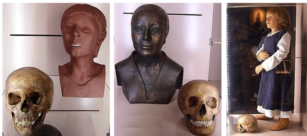
Flipje, ca. 9 jaar

Marcus werd forensisch gereconstrueerd, de skeletten kregen in dozen een tweede begraafplaats in het Erfgoedhuis, op het Catharinaplein bieden twee glazen kijksleuven een inkijkje in de onderwereld en in de Catharinakerk is een kleine archeologische tentoonstelling.