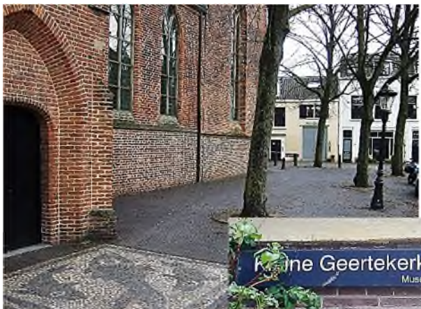
Kleine Geertekerkhof Museumkwartier