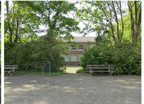
ca. 1900: achter hek begraafplaats 2015: school op voormalige terrein

In 1764 werd in Kampen de eerste begraafplaats voor joden in gebruik genomen in het Bolwerk bij de Veenpoort. Deze begraafplaats is na 65 jaar dienst te hebben gedaan op het eind van 1829 gesloten. Omdat men de ruimte nodig had voor de uitbreiding van de stad werd in 1843 een deel van de graven van de oude begraafplaats overgebracht naar de andere kant van de weg, de huidige Eerste Ebbingestraat. En in 1947 werden ze nog een keer verplaatst, nu naar de Israëlitische Begraafplaats in IJsselmuiden, maar of het onder rabbinaal toezicht is gebeurd, is onbekend. In 1955 werd het terrein bebouwd met een