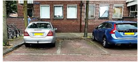
Amersfoort - Sint Janskerkhof

Er zijn meer voormalige begraafplaatsen, die nu fungeren als parkeerplaatsen. In Amersfoort ligt aan het Sint Janskerkhof een parkeerdek op een afgesloten terrein tussen de huizen met een slagboom, dat je via een toegangspas betreedt. Je kunt er voor € 13.500 euro een parkeerplek kopen. Is een graf niet goedkoper?