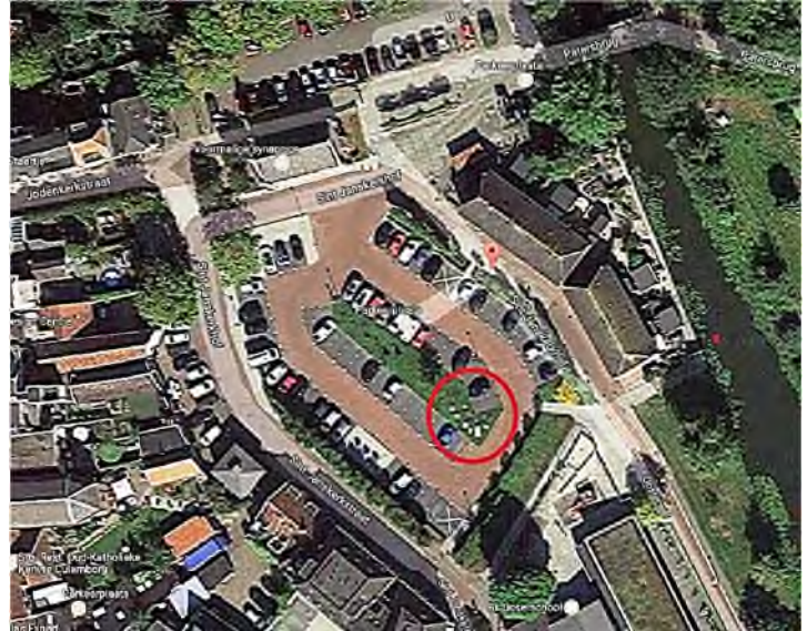
Culemborg - Parkeerplaats Sint Janskerkhof in de rode cirkel de oude grafstenen

Tot 1870 lag hier een begraafplaats. Later werd op deze plaats de school De Leilinden gebouwd. Na de afbraak van de school en voor de aanleg van de parkeerplaats vond er in 2014 een archeologisch onderzoek plaats, waarbij 12 oude grafstenen werden gevonden. De grafstenen hebben nu een plaats gekregen op de parkeerplaats. De stoffelijke resten die toen ook werden gevonden, zijn herbegraven op de Algemene Begraafplaats aan de Achterweg in Culemborg.