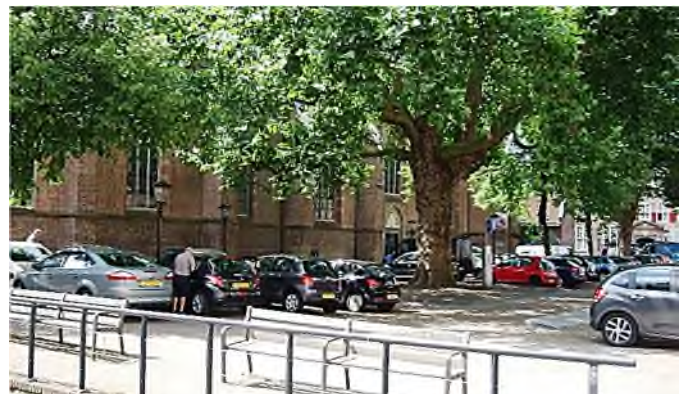
Utrecht - Nicolaaskerkhof