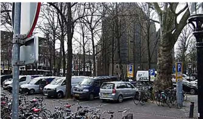
Utrecht - Janskerkhof

Het Nicolaaskerkhof is het plein ten noorden van de Nicolaaskerk, dat dienst doet als parkeerplaats. De Nicolaïkerk ofwel 'Klaaskerk' doet al meer dan 800 jaar dienst als parochiekerk, nu voor de Protestantse gemeente Nicolaïkerk. In de kerk zijn enkele interessante funeralia te zien: grafzerken, een dodenmasker uit ca. 1704 en een Laatste Oordeelschilderij uit 1562.