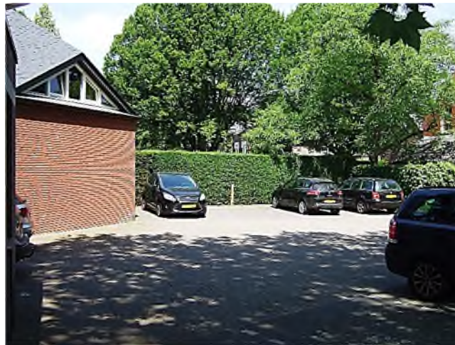
parkeerplaats boven grafkelder