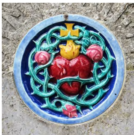
Augsburg - Protestantischer Friedhof

De verschillende componenten van een begraafplaats worden wel eens aangeduid met de kleuren rood voor bouwwerken, groen voor aanleg, beplanting, inrichting, grijs voor graftekens en blauw voor waterpartijen.