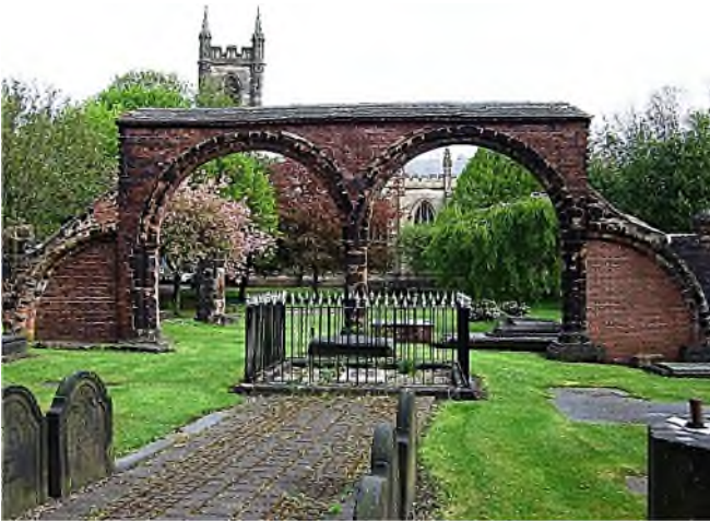
ruïne van de originele middeleeuwse kerk met daarvoor binnen het hekwerk het graf van Josiah Wedgwood

Stoke-on-Trent is sinds de 17 e eeuw de thuisbasis van de keramische industrie in Engeland en staat bekend als The Potteries . Porselein- en aardewerkfabrieken, o.a. Spode, Royal Doulton, Wedgwood en Minton zijn hier begonnen.