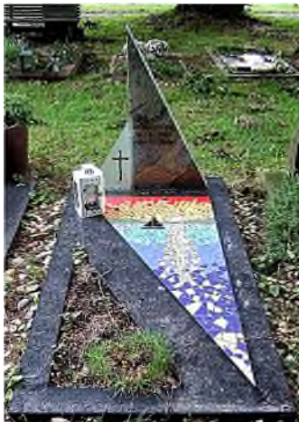
Nijmegen - Daalseweg