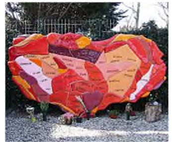
R'dam - St. Laurentius