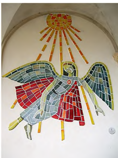
Karlsruhe - Hauptfriedhof

Op staande graftekens met keramisch mozaïekwerk wordt vaak gebruik gemaakt van tegels, in verschillende maten gesneden, of van scherven van tegels of serviesgoed.