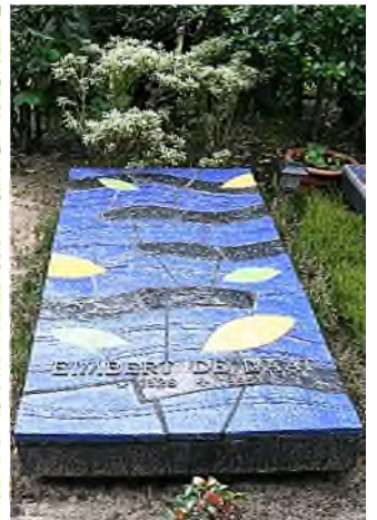
Eindhoven - Roosten