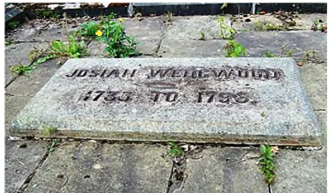
het graf van Josiah Wedgwood

Op de graven van de Potters zijn geen graftekens met keramiek te vinden, maar op de begraafplaats zelf staat wel een bank, grotendeels van keramisch mozaïek gemaakt.