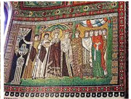
Ravenna - Basilica di San Vitale: centraal Christus, links keizer Justinianus, rechts keizerin Theodora

Na de Renaissance raakte de mozaïekkunst in verval, maar eind 19 e , begin 20 e eeuw was er weer een opleving. De Spaanse architect Antonio Gaudí (1852-1926) ontwikkelde een unieke methode om zowel