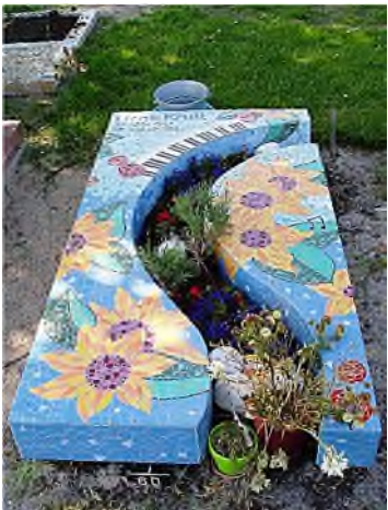
Almere - Stad