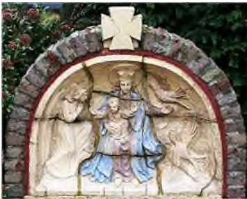
Arnhem - Moscowa

staan uit grote onregelmatig gevormde en aan elkaar geplaatste stukken materiaal, c.q. keramiek. De voorbeelden maken het duidelijk.