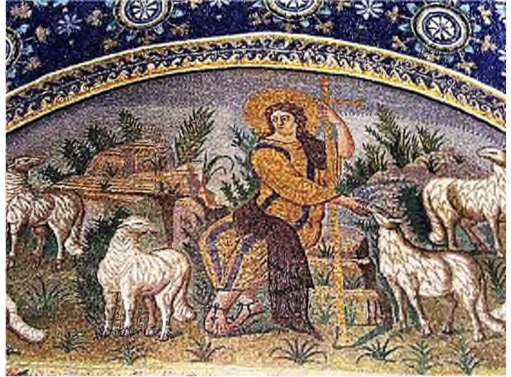
Ravenna - Mausoleo di Galla Placidia: mozaïek met smalti

In het Byzantijnse tijdperk (vanaf de 6 e eeuw) breekt er een nieuwe tijd aan voor de kunstvorm mozaïek, waarvan in Ravenna -een belangrijke schakel tussen Oost en West- veel voorbeelden zijn te zien. Toen ontstond er ook een nieuw soort materiaal voor mozaïeken, namelijk smalti. Smalti is een door en door gekleurde, ondoorzichtige glassoort, dat nu het belangrijkste materiaal voor de mozaïekkunst werd. In de Byzantijnse stijl werd ook veel goud gebruikt, gemaakt door goudfolie tussen twee heldere glasplaatjes te smelten. Keramische tesserae , in de vorm van vierkante tegeltjes, scherven van tegels of kapot serviesgoed, werd pas veel later toegepast.