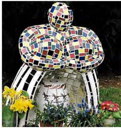
Nijmegen - Rustoord

Dit thema gaat specifiek over het materiaal van grafmonumenten, dat keramiek wordt genoemd. Het is de algemene term voor producten op basis van klei, die één of meer keer in een oven zijn gebakken. Er zijn vier hoofdtypen: grof keramiek,