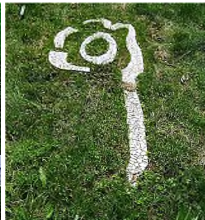
Amsterdam - De Nieuwe Ooster