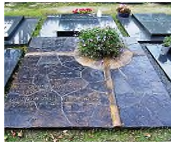
Helmond - Hortsedijk