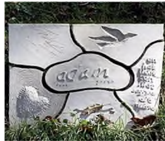
A'dam - Nieuwe Ooster