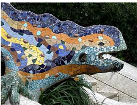
Antoni Gaudí - Parc Güell

Na de Renaissance raakte de mozaïekkunst in verval, maar eind 19 e , begin 20 e eeuw was er weer een opleving. De Spaanse architect Antonio Gaudí (1852-1926) ontwikkelde een unieke methode om zowel