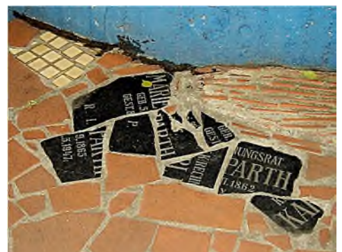
F. Hundertwasser - Hundertwasserhaus

grote vlakken als ruimtelijke structuren met mozaïekwerk te bedekken, o.a. te zien in de Sagrada Familia en Park Güell in Barcelona. Gaudí heeft ook de Oostenrijkse architect Friedensreich Hundertwasser (1928-2000) beïnvloed; zijn (mozaïek)werk is o.a. te zien in Wenen in het Hundertwasserhaus en het Hundertwassermuseum.