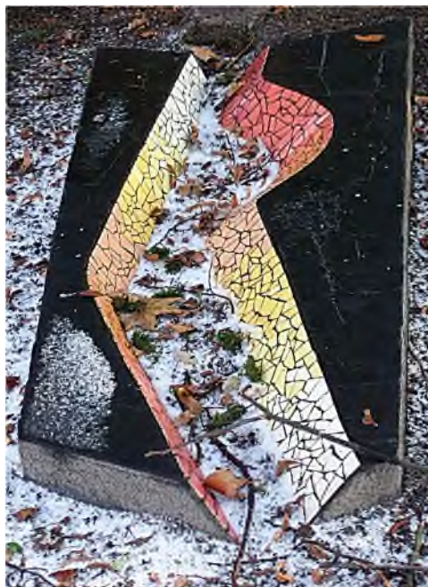
Delft - Jaffa

In de modeltuin op De Nieuwe Ooster in Amsterdam liggen een aantal voorbeelden van haar hand, maar ook elders, o.a. op begraafplaats Jaffa in Delft.