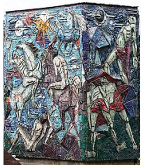
Turijn - Cimitero Monumentale

Het mozaïekmonument in Turijn is gemaakt van steengoed.