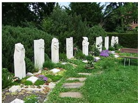
31. Der Paradiesgarten