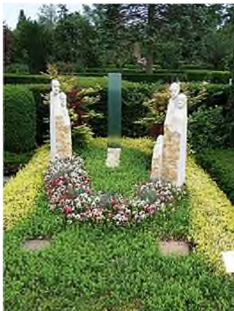
16. Diesseits und Jenseits

De expositie met voorbeelden van moderne grafkunst kan in een rondgang bekeken worden. Vanaf 30 mei 2011 loopt de permanente expositie 'Aspekte - die Einmaligkeit des Lebens' (Aspecten - de uniciteit van het leven) over een deel van het Hauptfriedhof van Karlsruhe. Daarin hebben 62 beeldhouwers/steenhouwers samengewerkt met 50 hoveniers om open ruimtes tussen bestaande grafplaatsen te voorzien van een modern vormgegeven grafteken en een bijpassende beplanting. De expositie is geen modeltuin, die dient als voorbeeld van moderne grafkunst en waar men zich kan laten inspireren voor een eigen grafteken elders. Het unieke van deze expositie is dat deze grafplaatsen met grafteken en beplanting ook gekocht kunnen worden en gebruikt kunnen worden als persoonlijke laatste rustplaats. Op bordjes bij de graven kunnen bezoekers titel, toelichting, kunstenaar, vormgeving en materiaal lezen.