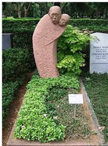
10. Zerrissen durch den Tod