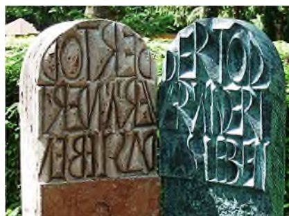
45. Der Tod verändert das Leben