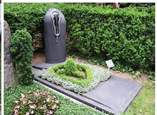
9. Tempus fugit- die die Zeit vergeht