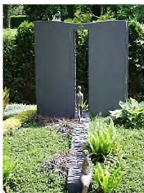
43. Was bleibt