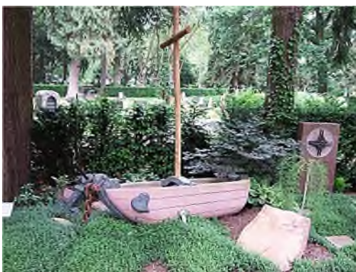
6. Glaube - Liebe - Hoffnung