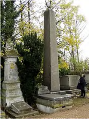
vingerwijzing naar boven

Er zijn slechts enkele mooie monumenten in goede staat gebleven, zoals het Stearnemausoleum en een obelisk als herdenking aan vijf Schotse nationalistenv die naar Australië werden verbannen.