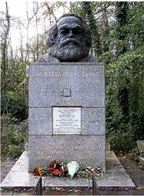
het graf van Karl Marx.