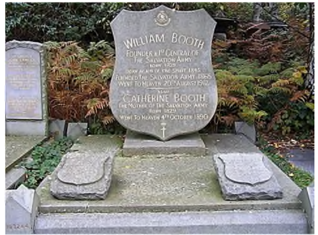
William Booth - Leger des Heils