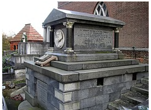
Charles Spurgeon & Sir Henry Doulton