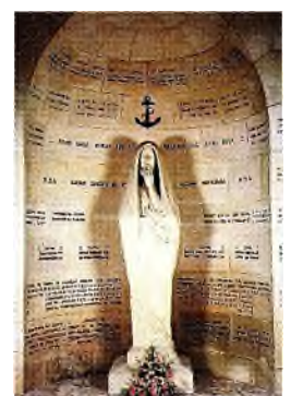
beeld van de Stilte