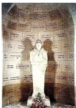
soldaat van Verdun

Recht tegenover de hoofdingang bevindt zich de katholieke kapel. Op drie borden staan de namen van de priesters, die in de loop van de oorlog gedood zijn. In de kapel bevinden zich twee graven: mgr. Charles Ginisty (1882-1946), bisschop van Verdun en de initiatiefnemer voor de oprichting van het ossuarium; Ferdinand Noel (1873-1944), de eerste kapelaan van het ossuarium.