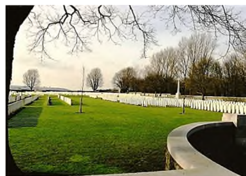
Marokkaans Monument Givenchy Road Canadian Cemetery Canadian Cemetery No. 2