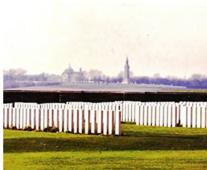
zicht op ND de Lorette vanaf Vimy