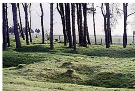
gepokt en gemazeld