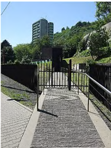
toegangspoort en -pad

Voor kohaniem , via Aäron de afstammelingen van de priesters, is het betreden van een begraafplaats volgens de halacha , de joodse wet, verboden. Op joodse begraafplaatsen zijn voor hen speciale paden aangelegd. Om hen ook de gelegenheid te geven de graven van de rabbi's te bezoeken, is er voor alle bezoekers een zwevend pad naar de ingang geconstrueerd dat de begraafgrond niet raakt.