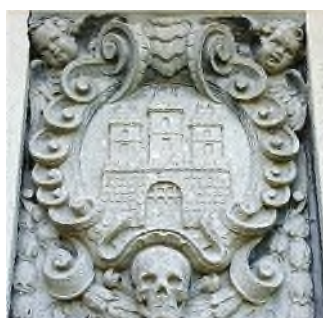
wapen van Bratislava