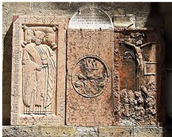
oude grafstenen tegen de kerkmuur