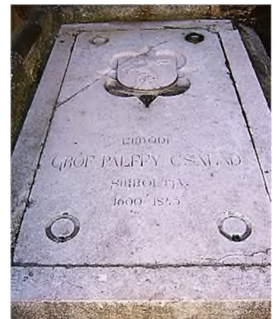
ingang grafkelder Pálffy

Onder de kathedraal bevinden zich catacomben en cryptes van onbekende lengte tot een diepte van zes meter. Tot nu toe zijn er drie cryptes ontdekt: de crypte van de familie Pálffy, de Jezüetencrypte en de Aartsbisschoppencrypte. Alleen de laatste is toegankelijk voor het publiek. Het bevat ongeveer 90 graven van aartsbisschoppen en andere kerkelijke dignitarissen en leden van adellijke geslachten. Ook Josef Ignác Bazja (1755-1836), de auteur van de eerste Slowaakse roman, is hier bijgezet. In de kerk hangt voor hem een epitaaf.