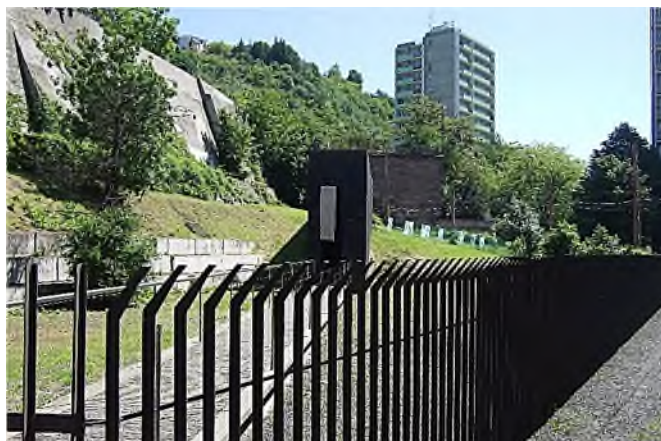
nu (2014) - Pamätník Chatama Sofera