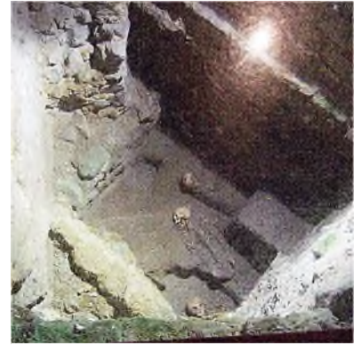
11e eeuwse kerkhof

Waar een ondergrondse joodse begraafplaats uitzonderlijk is, geldt dat niet voor christelijke kerken. Zij waren in het verleden ondergronds begraafplaatsen. Dat geldt ook voor de Sint Martinus kathedraal in Bratislava. De huidige gotische kathedraal werd vanaf het eind van de 13 e eeuw gebouwd op de plaats van een vroeger Romaans kerkje met kerkhof. De restanten van het 11 e eeuwse kerkhof zijn in de kathedraal in de diepte nog te zien via een glazen glasplaat in de kerkvloer.