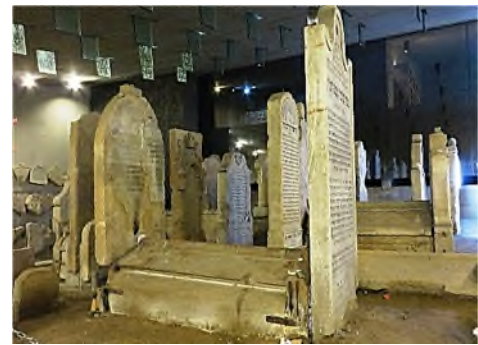
graf van Chatam Sofer

adres: Památník Chatama Sofera, Nábrežie armádneho generála Ludvíka Svobodu, Bratislava contact: tel. +421.2.54416949, e-mail: memorial@znoba.sk