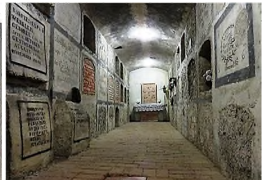
Sint Martinus kathedraal: Aartsbisschoppencrypte