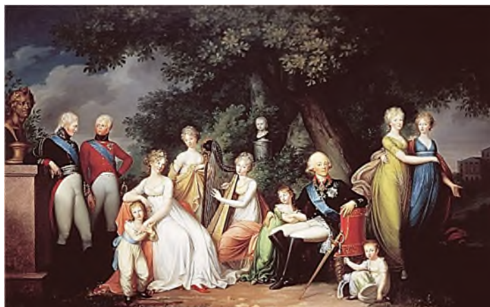
tsaar Paul I met echtgenote en 10 kinderen

In Rusland, waar de tsaren vaak veel kinderen kregen, waren veel huwelijkskandidaten. Duitsland met zijn vele staten, koninkrijken, hertogdommen en graafschappen had er ook veel en zo werden er tussen beide landen veel huwelijken gesloten. Zo hadden tsaar Paul I (1754-1801) en zijn echtgenote Sophie Dorothee von Württemberg (1759-1828) tien kinderen, vier zonen en zes dochters.